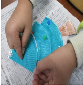
赤や白、黄色などのシールをそれぞれ貼っていました。