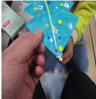
ツリーの先に穴を開け、好きな色の毛糸を通しました。