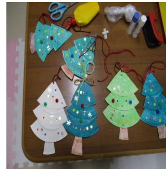
自分だけのオリジナルツリーの完成です。