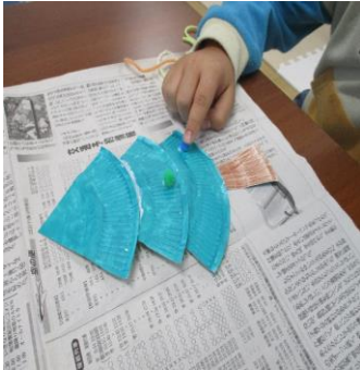
好きな色のデコレーションボールを好きな場所に貼りました。