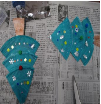
雪の結晶の他に天使を型取った銀紙を貼り付けてもOK。