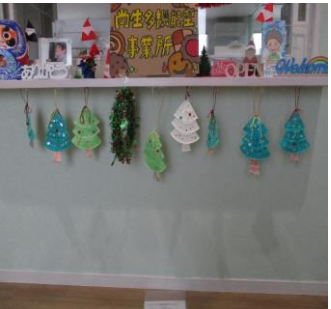
こども園の玄関先につるしました。