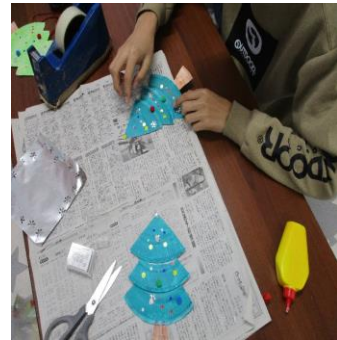
雪の結晶を型抜きした銀紙も貼りました！