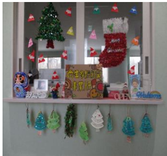
ガラスに貼っているのは、折り紙を折って作ったサンタさんです。